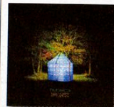
Dan Deacon Bromst CARPARK

Un altro irregolare del sottobosco indie statunitense, di solito catalogato un po' frettolosamente come "elettronico" solo perché fa uso disinvolto della tecnologia digitale per le sue composizioni. Vero: Bromst è in generale un po' meno dance dei (sei) dischi che lo hanno preceduto, ma in realtà Deacon è un freak che stilisticamente deve molto alla new wave più folle e tecnologicamente informale (qualcosa a metà strada fra Devo e Tom Tom Club: sentire la trascinante e caleidoscopica "Red F"), mentre come compositore abbina la verve onnicomprensiva di un Sufjan Stevens all'indisciplina elettronica dei Trans Am (in tal senso potrebbero rendere l'idea "Surprise Stefani" e "Snookered", anche se le voci campionate nella seconda parte di quest'ultima non somigliano davvero a niente di già sentito...). In Carpark si respira insomma un entusiasmo che fa pensare a un'espressione artistica senza preconcetti né vincoli di alcun tipo: se ci sono imperfezioni, fanno parte del gioco, e sono ampiamente scusabili di fronte a un'esuberanza creativa a tratti semplicemente irresistibile.